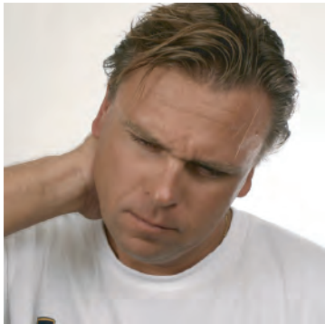
El dolor puede ser tratado.