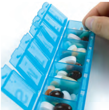
Hable con su médico acerca de su medicamento.