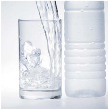
Beba por lo menos 8 vasos de agua cada día.

Algunos medicamentos para el dolor le pueden causar constipación. El estar constipado significa que usted solo tiene movimientos de vaciado intestinal (BM) alrededor de 2 veces a la semana. Aquí le diremos lo que usted puede hacer para no estar constipado.