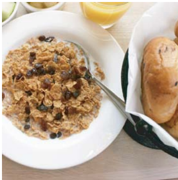
Coma mas alimentos que fibra.