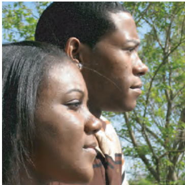
Pregúntele a su médico como puedes proteger tu bebe contra el VIH.