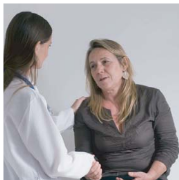
Solicite una hora con su doctor.

La depresión es algo más que simplemente sentirse triste por un largo periodo o incluso algunos días. La depresión podría describirse como un sentimiento de angustia o quizás desesperanza lo cual hace muy difícil llevar a cabo las tareas cotidianas.