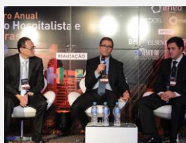
Mesas de Discussão entre os palestrantes e o público