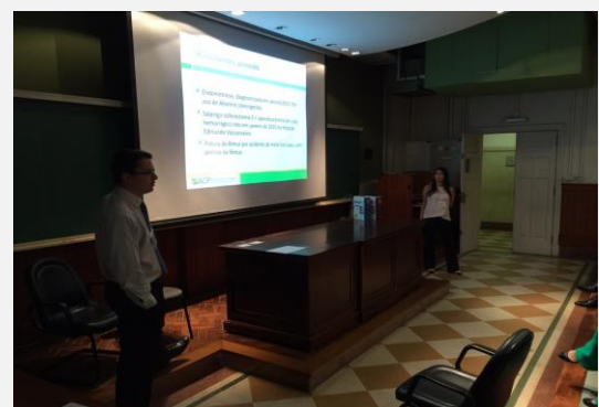
Discussão de casos clínicos

O III Encontro com estudantes do ACP Brasil acontecerá em Junho de 2016.*