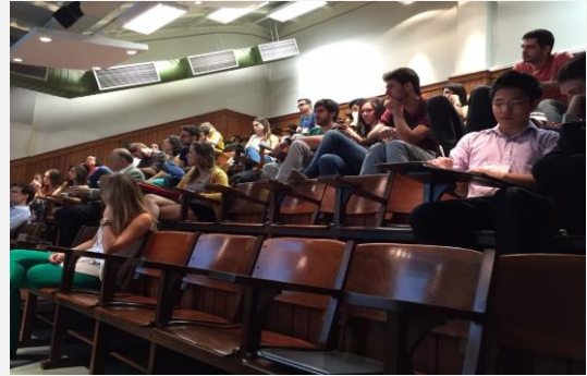
Público de estudantes de medicina

O encontro foi um sucesso com participação de estudantes da Faculdade de Medicina da USP, Faculdade de Medicina da Santa Casa de São Paulo, Universidade de Marília – UNIMAR, e PUC Campinas.