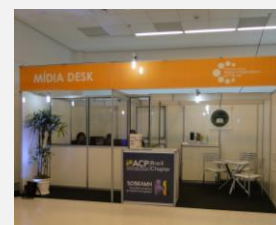
ACP Brasil e SOBRAMH