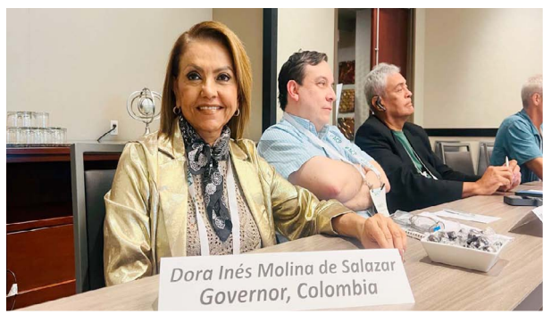
REUNIÓN DE GOBERNADORES AMERICAN COLLEGE OF PHYSICIANS - ACP • ARIZONA, ESTADOS UNIDOS