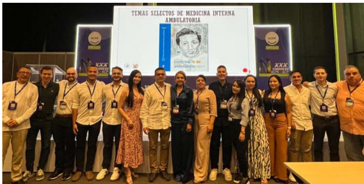
Profesores y Residentes de Medicina Interna de la Facultad de Ciencias para la Salud de la Universidad de Caldas, en el lanzamiento del libro Tópicos Selectos de Medicina Interna Ambulatoria . En el marco del XXX Congreso ACMI-ACP, 30 de julio a 2 de agosto, Barranquilla (Colombia).